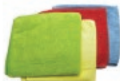
TOALLITA MICROFIBRA ECON.