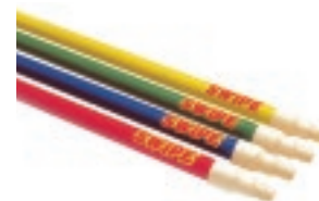
BASTÓN FIBRA DE VIDRIO 1.5m

Largo: 1.22m Rosca 7/8" y 3/4" Largo: 1.40m Rosca 7/8" y 3/4"