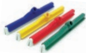
JALADOR DE AGUA