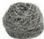
FIBRA ESPIRAL ACERO

40.5x38.2 cm Verde/Naranja/Azul/Amarillo