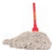
TRAPEADOR 300G C/BASTÓN

c/bastón plastificado Rosca 7/8" Repuesto 300g