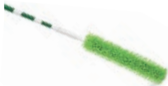
SACUDIDOR ABANICO DE TECHO

Bastón ajustable hasta 2.13m Cabezal flexible 45.7cm