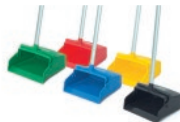
RECOGEDOR DE BASTÓN