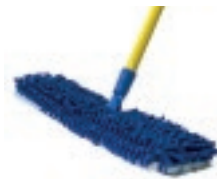
SACUDIDOR DE MICROFIBRA 2 EN 1

Largo: 1.29m Ancho: 42cm Repuesto de microfibra