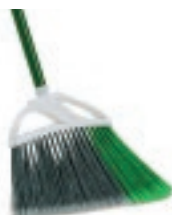
ESCOBA DOMÉSTICA 12"