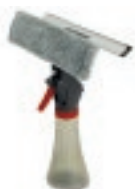
3 EN 1 LIMPIAVIDRIOS