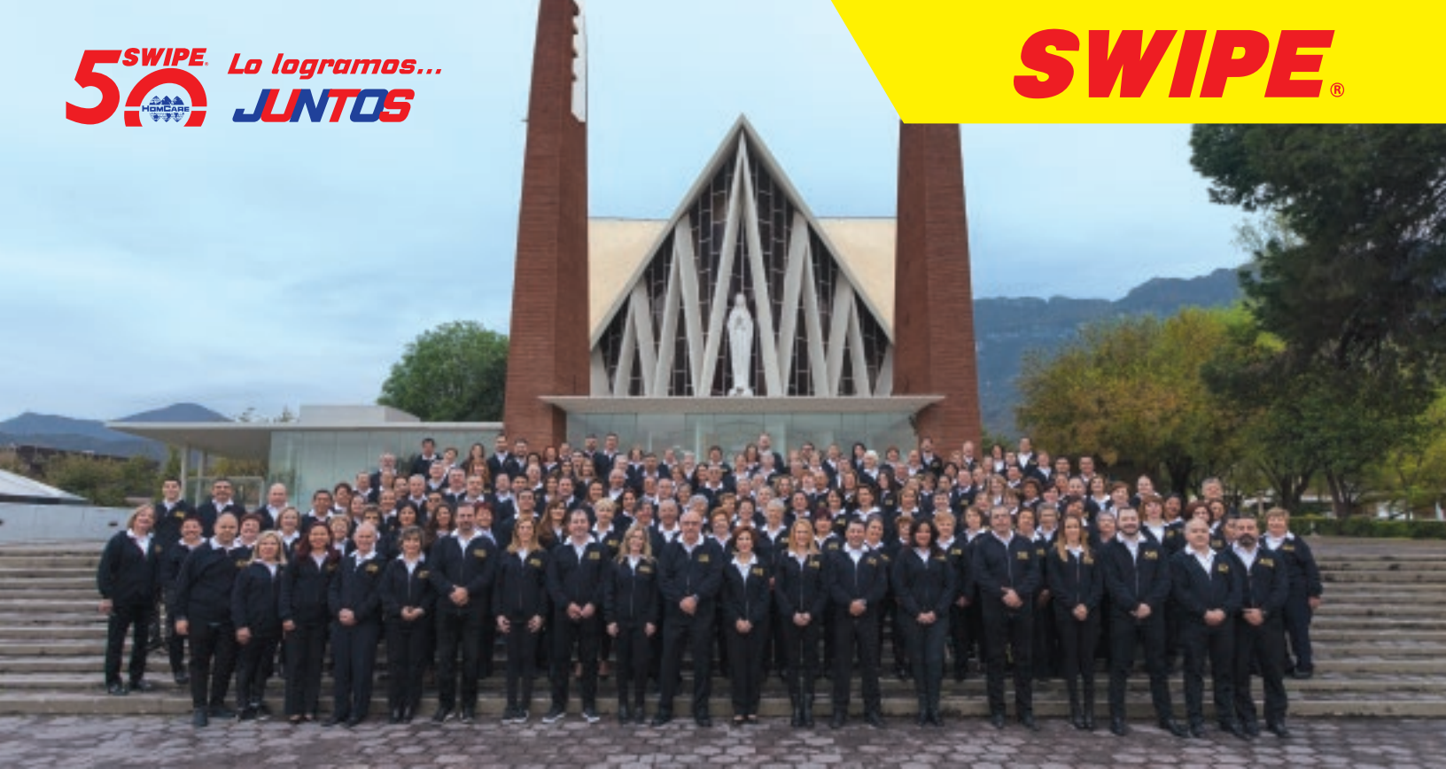
Seminario de Distribuidores, Monterrey, Nuevo León 2019