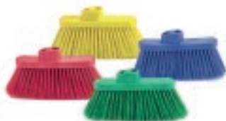
ESCOBA CODIGO DE COLOR