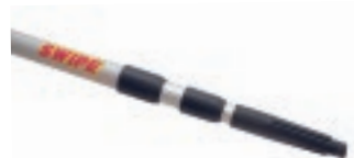
BASTÓN TELESCÓPICO 2.4m