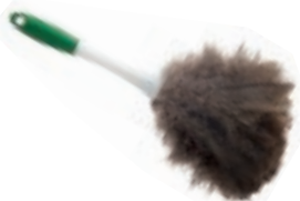
SACUDIDOR DE PLUMAS

Bastón ajustable hasta 2.13m Cabezal flexible 45.7cm