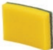
FIBRA VERDE CON ESPONJA