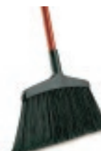
ESCOBA INSTITUCIONAL 15"