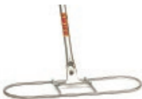
BASE METÁLICA P/MOP SECO