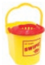
CUBETA CON EXPRIMIDOR

c/sistema exprimidor "manos secas" Repuesto WONDERMOP DOM.