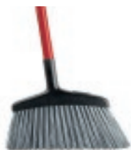
ESCOBA USO RUDO