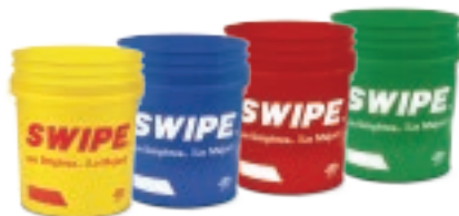
CUBETA VACÍA SWIPE