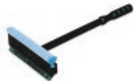
LIMPIAPARABRISAS CON ESPONJA