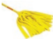
TRAPEADOR DE TIRAS

c/bastón plastificado Rosca 3/4" Repuesto Trapeador de tiras