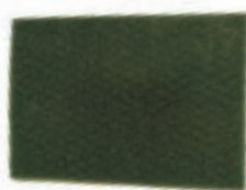
FIBRA VERDE MEDIANA