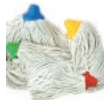
REP. TRAPEADOR CÓDIGO DE COLOR

c/bastón plastificado Rosca 3/4" Repuesto Trapeador de tiras